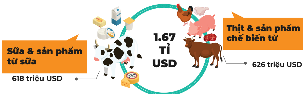
Tổng giá trị nhập khẩu của sản phẩm chăn nuôi trong 6 tháng đầu năm 2023